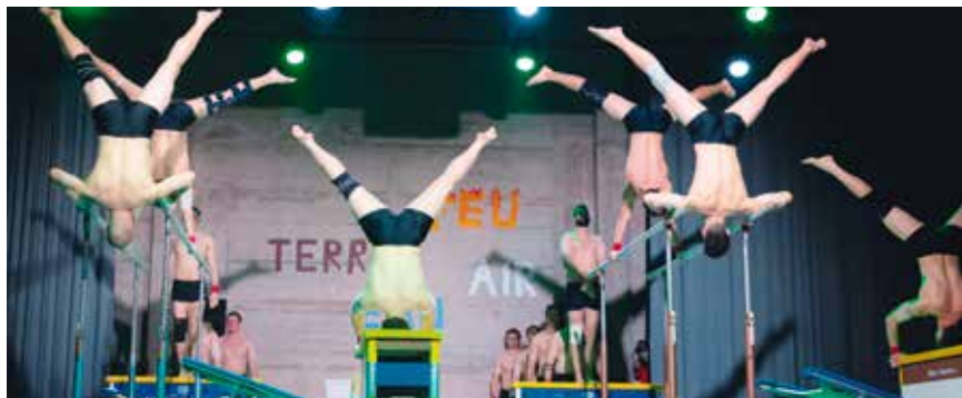
Comme toujours, la Gym Chézard livrera une soirée haut en couleur.

mardi 10 février. Le libellé de l'annonce est du ressort de la rédaction. Les lotos, matches aux cartes, cours particuliers, ne sont pas référencés dans l'agenda. Pour ce genre de manifestation, il faut se référer à la rubrique petites annonces sur www.valderuzinfo.ch .