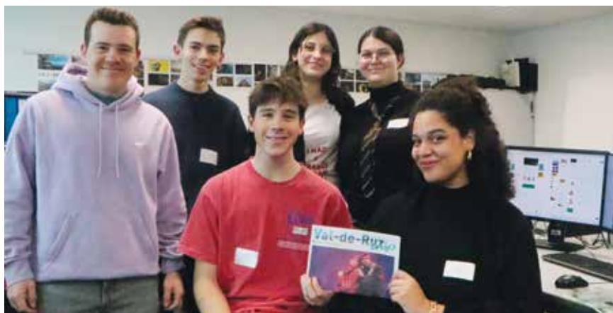
Photo de famille d'une partie de la classe en médiamatique qui réalise le site web de «Val-de-Ruz info».

Le nouveau site internet de «Val-de-Ruz info» est en phase de finalisation. Il propulsera le lecteur au cœur de l'information locale, via un design dynamique et repensé par... la jeunesse. Il est en effet le fruit du travail d'une classe de médiamatique du Centre de formation professionnelle neuchâtelois. Neuf étudiantes et étudiants qui ont mis leur créativité et leur savoir-faire dans un projet concret.