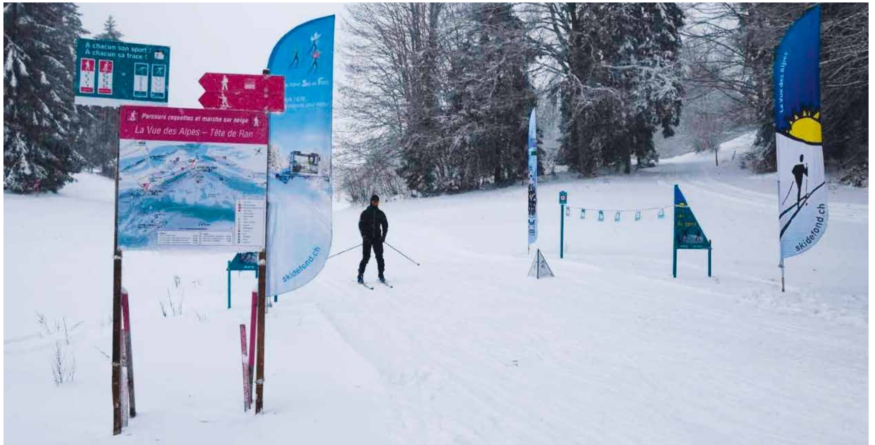
Le temps est gris, mais les amateurs de randonnées à skis ou de ski de fond seront ravis: il a neigé. D'ailleurs les fondeurs de la région (voir page 9) ne cessent de se mettre en valeur (photo pif).