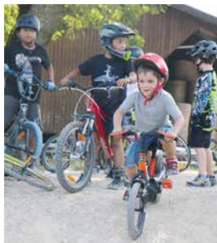
Apprendre à maîtriser son vélo dans la circulation ou avant cela au pump track (comme ici) est essentiel.

C'est un outil de travail précieux en faveur de l'éducation routière. La construction d'un jardin de circulation permanent au Val-de-Ruz prend forme. Celui-ci est érigé à Fontaines, sur un terrain du TCS.